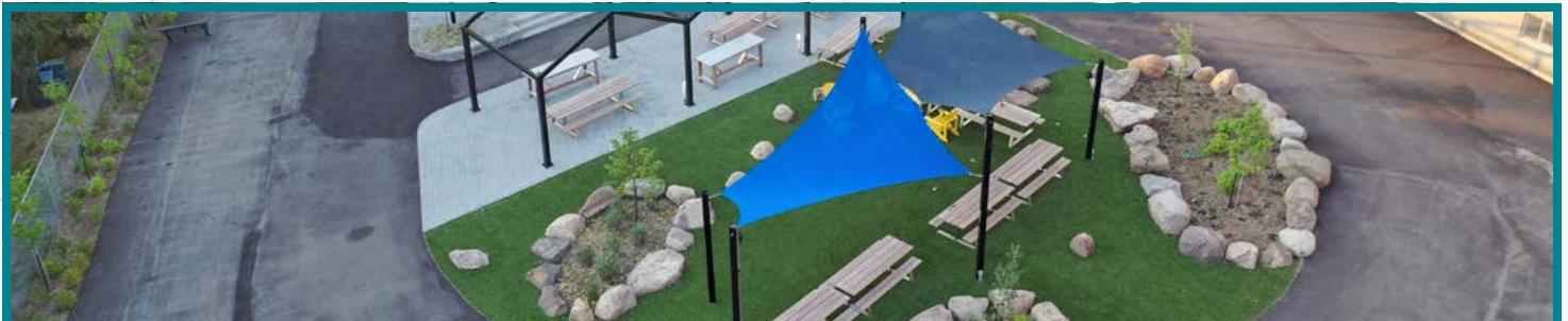
Cour d'école Collège Saint-Paul (Varenes)

Le concept d'aménagement de « zones » dans les parcs est une approche utilitaire et concrète documentée et éprouvée depuis quelques années dans les parcs scolaires de niveau primaire et dans les parcs municipaux, qui répond à la multiplicité des besoins de développement des enfants et des adolescents. Tout en évitant les risques de surprogrammation, séparer la cour d'école en différentes zones d'activités multiplie les opportunités d'être physiquement actif. Cela permet de stimuler la créativité, de répondre aux besoins variés et évolutifs des jeunes, mais aussi de limiter les conflits d'usages et d'usagers. Organiser la cour en zones implique un aménagement cohérent, lisible et compréhensible pour chacun. Attention, le lignage n'est pas la solution miracle !